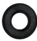
3.201.00 Kleberosette in Schwarzstahl-Optik*